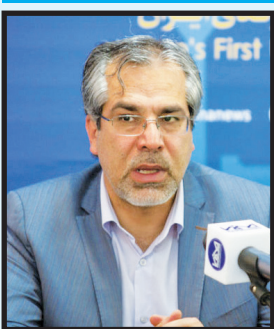
پیشنهاد رئیس هیئت کلف استان اصفهان به شهرداری:

۱۵ زمین کلف در مناطق ۱۵ گانه شهر راه‌اندازی شود