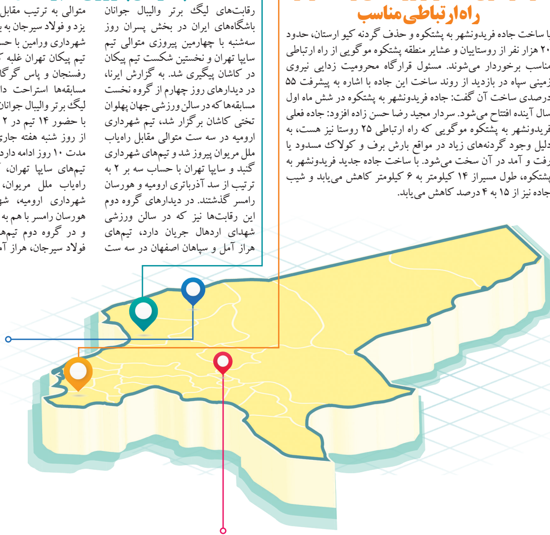
در طرح شهدای سلامت:

با ساخت جاده فریدونشهر به پشتکوه و حذف گردنه کیو ارستان، حدود ۲۰ هزار نفر از روستاییان و عشایر منطقه پشتکوه موه‌گویی از راه ارتباطی مناسب برخوردار می‌شوند. مسئول قرارگاه محرومیت زدایی نیروی زمینی سپاه در بازدید از روند ساخت این جاده با اشاره به پیشرفت ۵۵ درصدی ساخت آن گفت: جاده فریدونشهر به پشتکوه در شش ماه اول سال آینده افتتاح می‌شود. سردار مجید رضا حسن زاده افزود: جاده فعلی فریدونشهر به پشتکوه موه‌گویی که راه ارتباطی ۲۵ روستا نیز هست، به دلیل وجود گردنه‌های زیاد در مواقع بارش برف و کولاک مسدود یا رفت و آمد در آن سخت می‌شود. با ساخت جاده جدید فریدونشهر به پشتکوه، طول مسیر از ۱۴ کیلومتر به ۶ کیلومتر کاهش می‌یابد و شیب جاده نیز از ۱۵ به ۴ درصد کاهش می‌یابد.