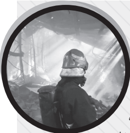
شهری دخالت دهد