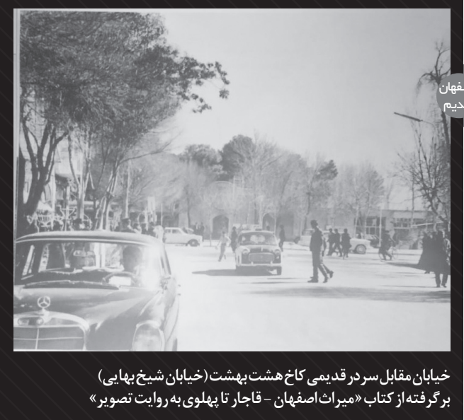
خیابان مقابل سردر قدیمی کاخ هشت‌بهشت (خیابان شیخ بهایی) برگرفته از کتاب «میراث اصفهان – قاجار تا پهلوی به روایت تصویر»