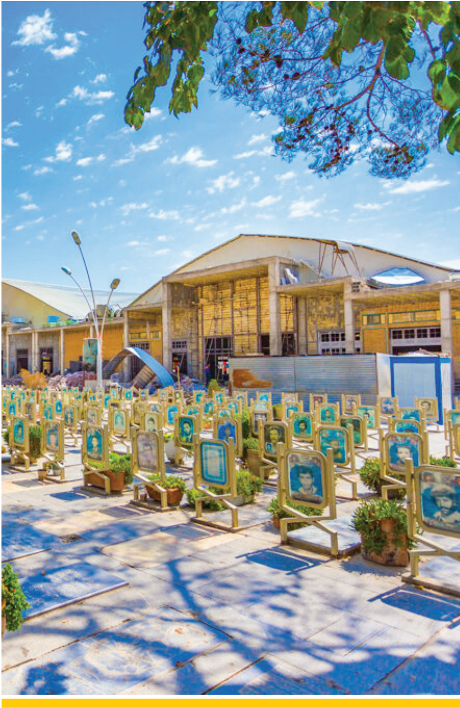
مدیر منطقه شش شهرداری اصفهان: یک هزار و ۳۰۰ میلیارد ریال صرف تملک و اجرای این پروژه شد