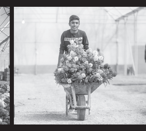
شهر در قالب