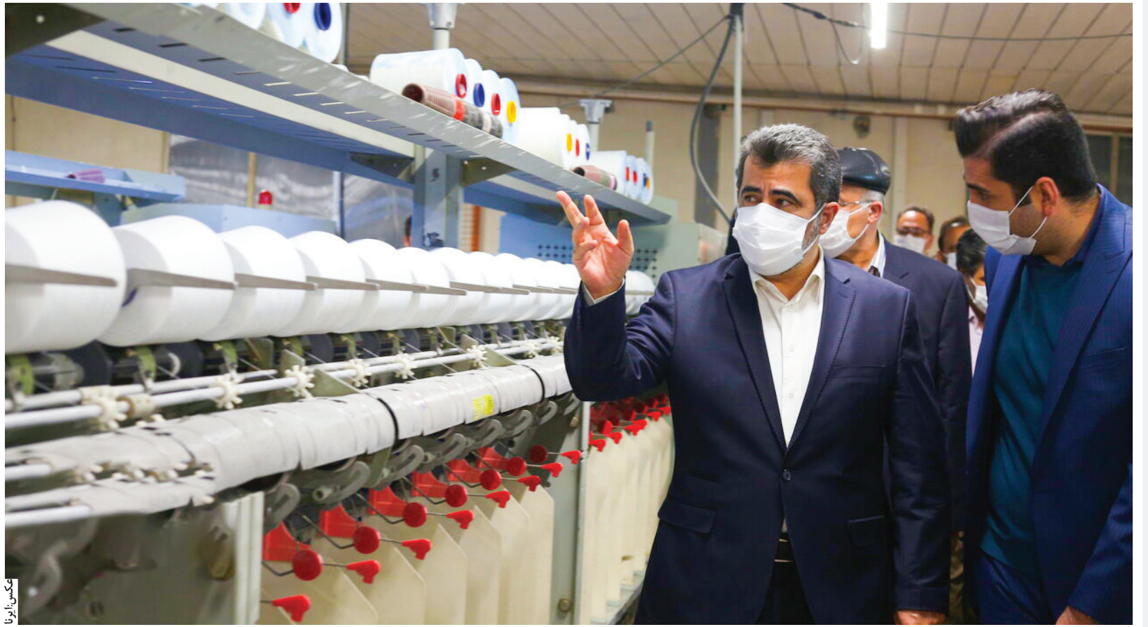
معاون اقتصادی وزیر کشور در سفر به اصفهان عنوان کرد: