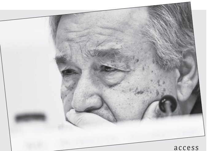
access for all countries to COVID-19

Thirteen ministers were scheduled to address the meeting on improving access to COVID-19, including new United States Secretary of State Antony Blinken. On Tuesday, Mexican Foreign Minister Marcelo Ebrard said Mexico would stress the importance of equal