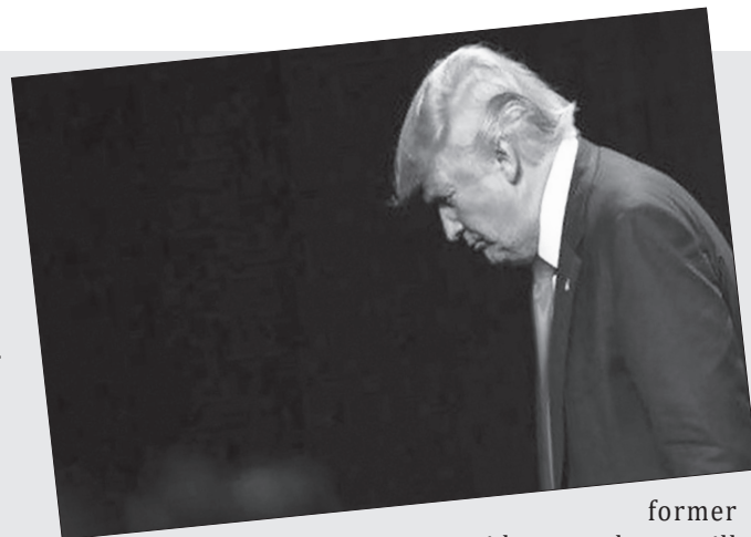
former president who still commands voters' attention.

"The more time we have to get up and running... The better," Biden said Friday in brief comments to reporters. Republicans were eager to delay the trial, putting distance between the shocking events of the siege and the votes that will test their loyalty to the