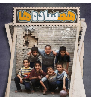
هم دلد بودند

طرح های «همساده ها» با اشاره بر ساده زیستی گذشته و یادآوری نوستالژی قدیم روی ۳۰۰ گالری شهری قرار گرفت. رییس اداره توسعه فرهنگ شهروندی سازمان فرهنگی اجتماعی ورزشی شهرداری اصفهان گفت: رویکرد تابلوهایی که در این دوره روی گالری های شهر نصب شده با گذشته متفاوت بوده و قرار است به صورت سریالی در معرض دید شهروندان قرار گیرد.