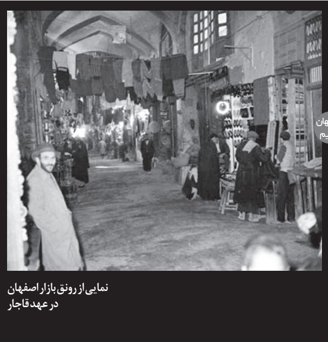
نمایی از رونق بازار اصفهان در عهد قاجار

اصفهان حدود ۲ میلیون نفر جمعیت دارد و بطور میانگین روزانه ۹۰۰ هزار دستگاه خودرو در آن، تردد می کند؛ این خطه آلوده ترین کلانشهر کشور است. در این استان افزون بر ۹ هزار واحد تولیدی و صنعتی فعالیت دارد.