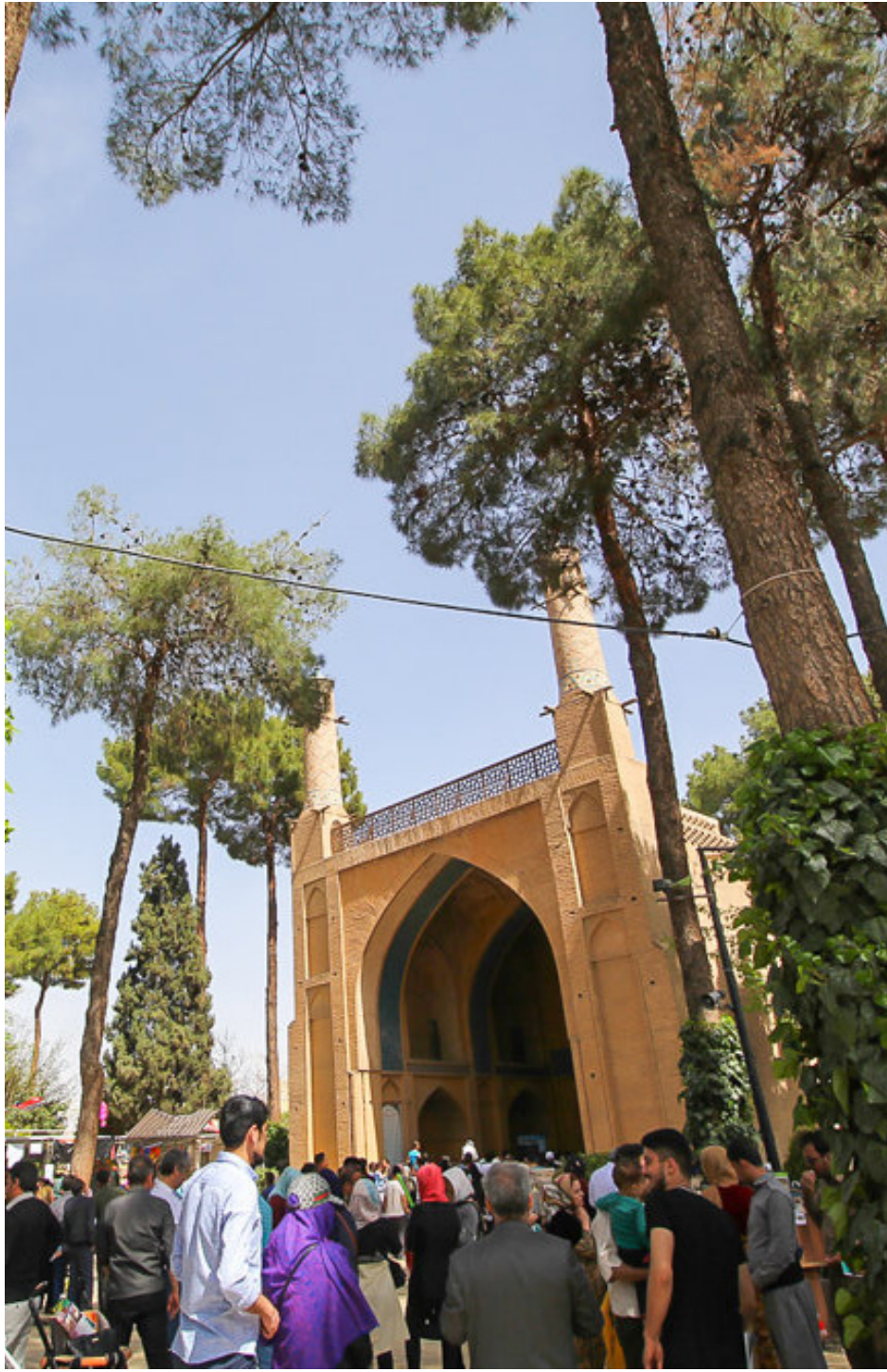
مدیر کل میراث فرهنگی اصفهان:

ارتقای صنعت گردشگری اصفهان مستلزم بهبود زیرساخت‌های حمل و نقل است