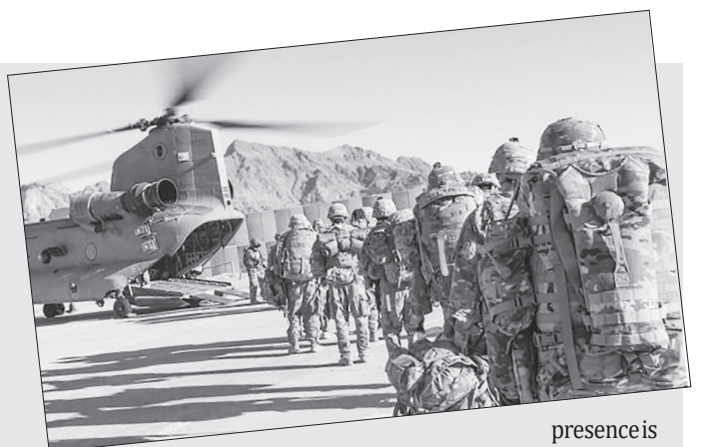
presence is a serious threat to the security of

Afghanistan's security situation remains a source of concern due particularly to terrorist acts perpetrated including by Daesh, whose