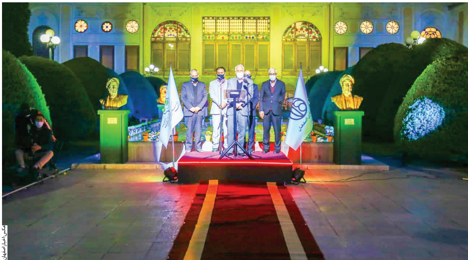
تعمیرات باغچه اصفهان

گام بلند سازمان فرهنگی اجتماعی ورزشی شهرداری در هفته اصفهان برداشته شد ؛