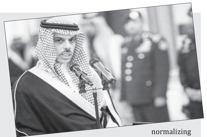
normalizing ties with Israel, an anti-regime

Meanwhile, the pro-Israel Saudi Crown Prince, Mohammed bin Salman (MBS), fears deadly reprisal from his own relatives if he joined the United Arab Emirates (UAE), Bahrain and Sudan in