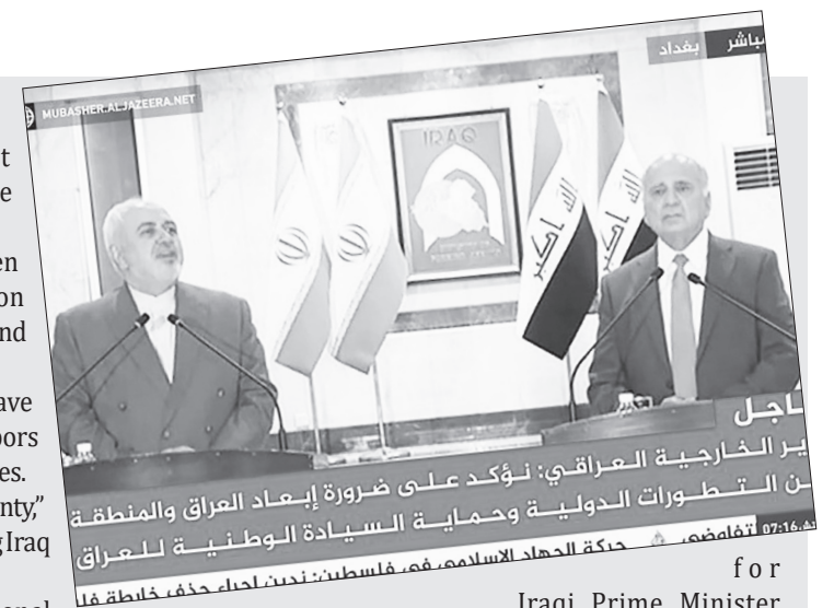
for Iraqi Prime Minister Mustafaal-Kadhimi's upcoming trip to Tehran. Zarif is going to visit Erbil in the afternoon at the invitation of President of the Iraqi Kurdistan Region Nechirvan Barzani.

The top Iranian diplomat has visited Baghdad to make arrangements