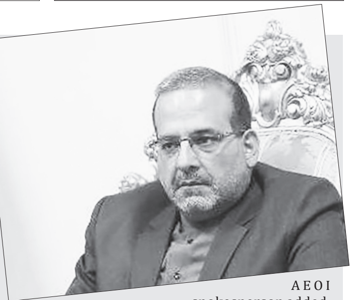
AEOI spokesman added.

The accident has not resulted in any human casualties nor has it disrupted the ongoing activities at the site, the