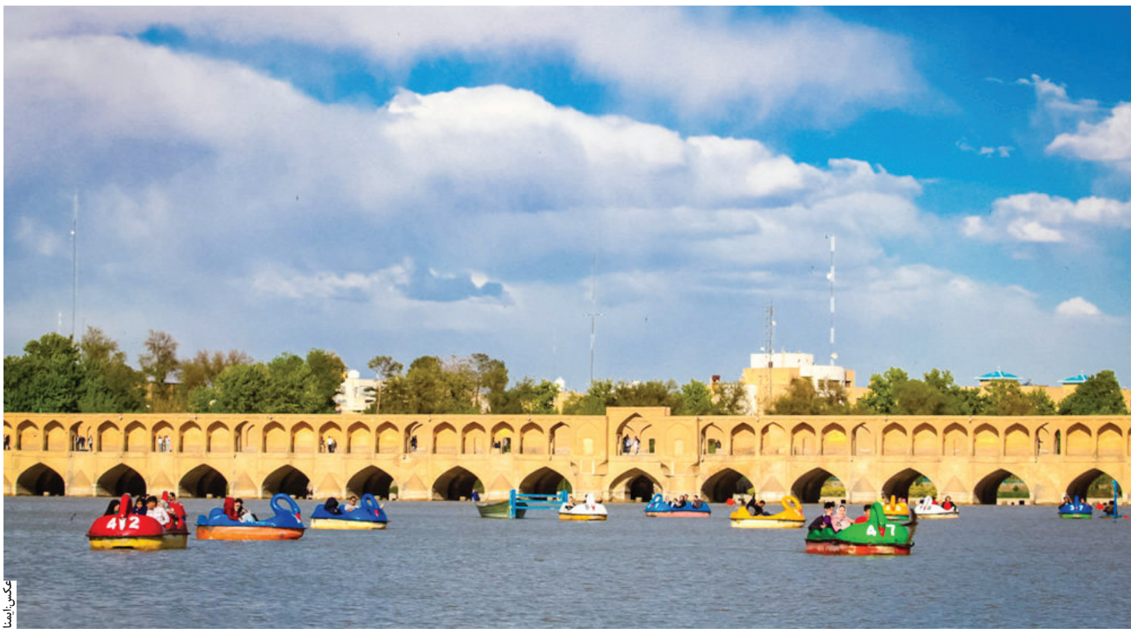
شهر دار اصفهان: