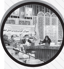
مدیران اجرایی دو شهر خواهر خوانده اصفهان و سن پترزبورگ در نشست ویدئو کنفرانسی در محل شهرداری اصفهان.

مدیر کل ارتباطات و امور بین الملل شهرداری اصفهان افزود: در پی نامه نگاری بین مدیران دو شهر اصفهان و سن پترزبورگ و مدیران ارشد این شهر بحث تبادل تجربیات با قالب این نشست مطرح شد که برای اولین بار است در سطوح مدیران اجرایی نشست آنلاین بین دو شهر برگزار می‌شود و در خصوص جزئیات موضوعات بحث می‌شود. وی افزود: اداره کل ارتباطات و امور بین الملل در ادامه این روند اقداماتی را در این راستا انجام خواهد داد؛ از جمله با انجام این تالار توسعه شهری و دیگر شهرهای خواهر خوانده اصفهان نشست‌های مشترک برگزار می‌شود.