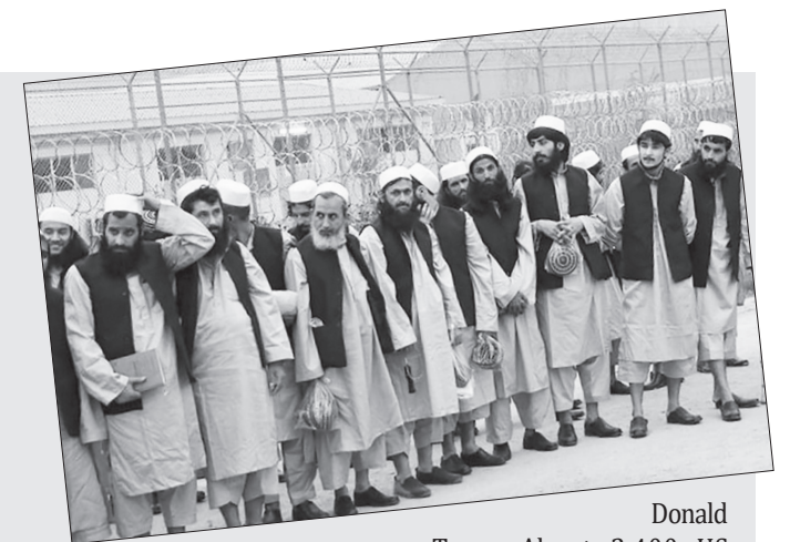
Donald Trump. About 2,400 US soldiers have been killed, along with unknown numbers of Afghan troops and Taliban militants. Over 100,000 Afghans have been killed or injured since 2009 when the UN Assistance Mission in Afghanistan began documenting casualties. About 14,000 US troops and approximately 17,000 troops from NATO allies and partner countries remain stationed in Afghanistan.

American forces have since remained bogged down in Afghanistan through the presidencies of George W. Bush, Barack Obama, and now,