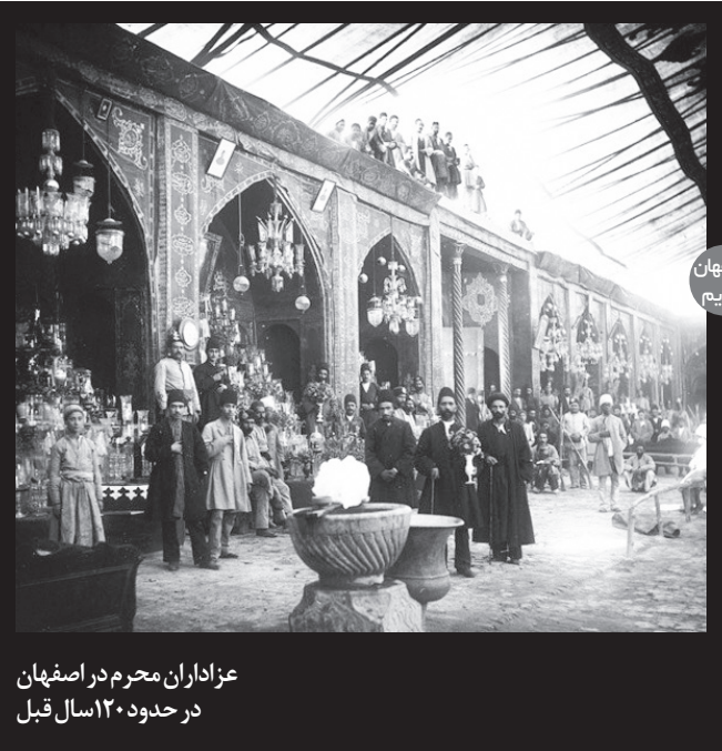
عزاداران محرم در اصفهان در حدود ۱۲۰ سال قبل

وی ادامه داد: همین رویکرد باعث شده که فولاد مبارک از ابتدای راه اندازی تاکنون در حوزه های آب، پسماند و خاک پروژه های مختلفی را تعریف کند و در هر پروژه ای مفاهیم و الزامات زیست محیطی را رعایت کند، به گونه ای که الزامات زمانه در حد استاندارد، بلکه فراتر از آن نیز به اجرا در آورد.