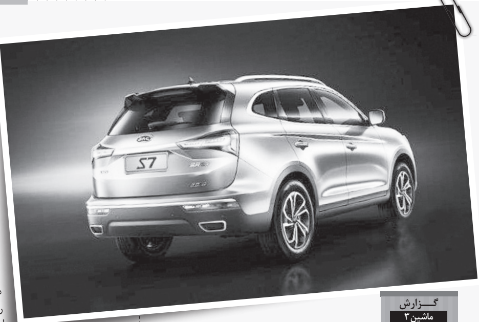
گزارش ماشین ۲

جک SV لیست نسبتاً کاملی از آپشن ها و تجهیزات رفاهی را در اختیار شما قرار می دهد که از مهم ترین آنها می توانیم چراغ های جلو هالوژنی، سیستم های ترمز و پایداری ABS، EBD، ESC، HAS، EBP، CDP، تهویه مطبوع اتوماتیک