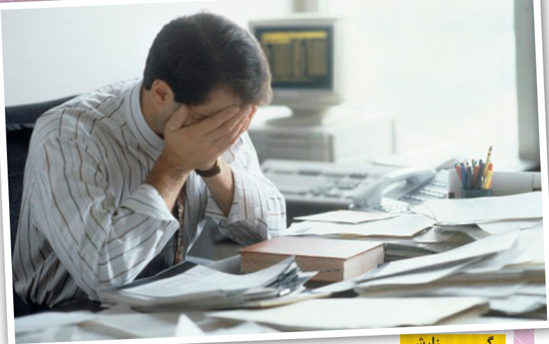
گزارش سایت medium.com

مدیر ارشد پور تقوی‌وی باید تضمین کند که شرکت به دنبال طیفی از فرصت‌ها و مدل‌های کسب و کار است که رشد آینده را ایجاد خواهند کرد. برخی از آن فرصت‌ها بر از ریسک و برخی کم ریسک خواهند بود. این وظیفه مدیر ارشد پور تقوی‌وی است که تضمین کند یک پورتفولیوی گسترده وجود دارد. این شخص باید محیطی که شرکت در آن کار می‌کند را در نظر بگیرد و سبب باید پورتفولیو را با آن محیط تطبیق دهد تا شرکت موقعیت خوبی برای آینده