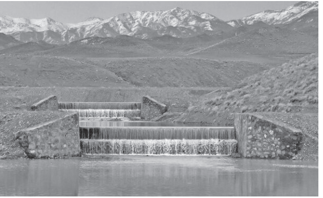
معاون آبخیزداری اداره کل منابع طبیعی استان اصفهان از کنترل و استحصال ۳۰ میلیون

تربیت طلبه، یک کار انبیايي از ناحیه خداوند است که در مدارس حوزه عملیه به آن پرداخته می‌شود. به گزارش خبرگزاری صداوسیما، مرکز اصفهان؛ مدیر حوزه علمیه اصفهان در نشست مدیران مدرسه علمیه حوزه علمیه اصفهان، یکی از چالش‌های پیش روی حوزه‌های علمیه و دیگر مراکز علمی-آموزشی حتی دانشگاه‌ها را جذب جوانان دانست و گفت: نباید برای خدا می‌خواهید حوزه را اداره کنید و وابسته به جایی نیستید و در صورت تیکه تلاش