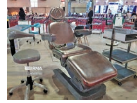
پانویون ملی شرکت‌های دانش بنیان با حمایت معاونت علمی، فناوری و اقتصاد دانش بنیان ریاست جمهوری، اردیبهشت ۱۴۰۳ در نمایشگاه بین‌المللی پزشکی و داروسازی ویتنام برپا می‌شود.

به گزارش گروه علم و آموزش ایرنا از مرکز ارتباطات و اطلاع‌رسانی معاونت علمی، فناوری و اقتصاد دانش بنیان ریاست جمهوری، سی و یکمین نمایشگاه بین‌المللی پزشکی و داروسازی ویتنام با حمایت سازمان توسعه همکاری‌های علمی و فناوری بین‌المللی معاونت علمی، فناوری و اقتصاد دانش بنیان ریاست جمهوری از ۱۲ تا ۱۹ مه (مصادف با ۲۰ تا ۲۷ اردیبهشت ۱۴۰۳) در محل کاخ فرهنگی ویت خود در شهر هانوی پایتخت ویتنام برگزار خواهد شد. پانویون ملی شرکت‌های دانش بنیان در رویداد