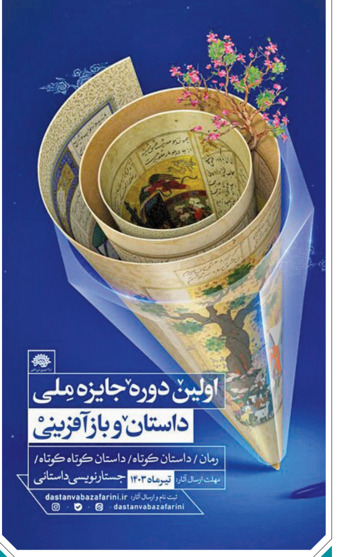
اولین دوره جایزه ملی داستان و وب‌آفرینی