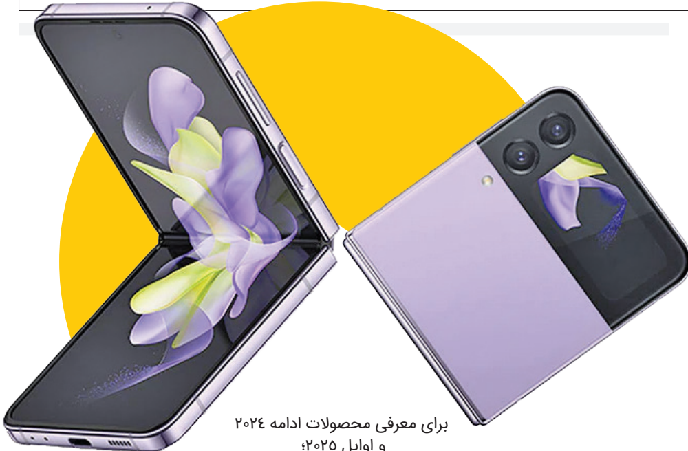
برای معرفی محصولات ادامه ۲۰۲۴ و اوایل ۲۰۲۵: