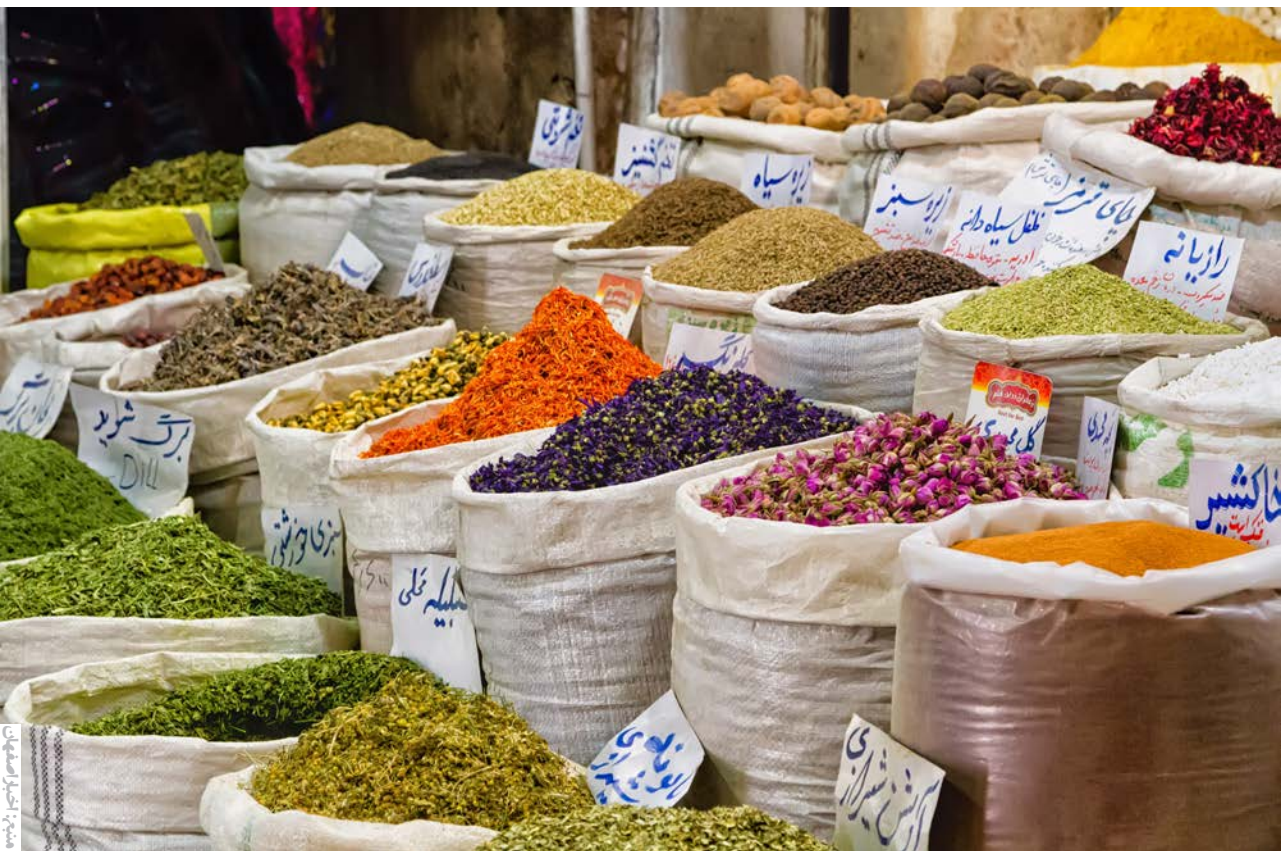
در سال گذشته؛