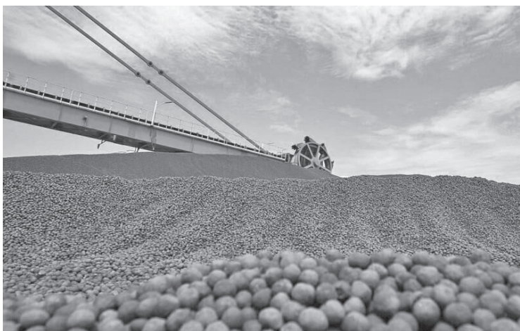
Production of sponge iron in Iran rose by 8.8 percent during the first 11 months of the current Iranian calendar year (March 21, 2023-February 19, 2024), as compared to the

same period of time in the past year, according to the data released by the Iranian Steel Producers Association (ISPA). The ISPA reported that 31.466 million