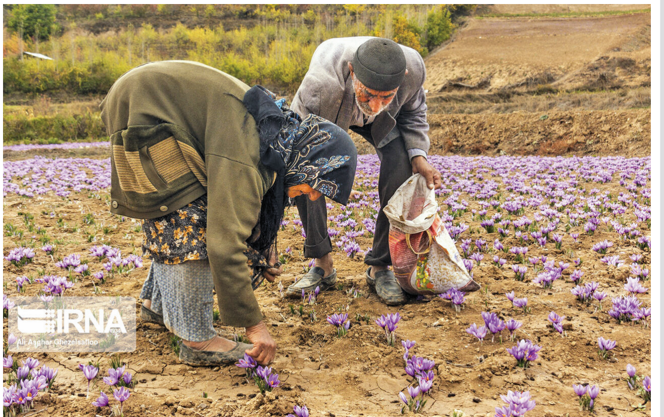
نایب رئیس شورای ملی زعفران: