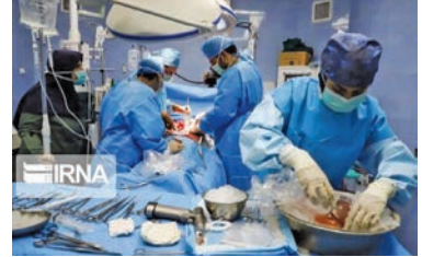
مراحل تحقیق و توسعه این محصول با برند ویسکانزینیل (WISCONSINIL) در شرکت زیست فناوران نیلفر انجام شد و راهبری محصول تا مرحله نهایی و تجاری سازی

محلول نگهداری بافت پیوندی برای اولین بار در ایران توسط محققان پژوهشگاه رویان جهاد دانشگاهی تولید شد. این محلول موفق به کسب مجوز تولید از سازمان غذا و دارو شده است. به گزارش گروه علم و آموزش ایرنا، پس از نزدیک به پنج سال تلاش و پیگیری، محلول نگهداری بافت پیوندی (کلیه و کبد) به عنوان اولین محصول موضوع سرمایه گذاری خطرپذیر (Venture Capital) پژوهشگاه رویان و تامین سرمایه لوتوس پارسیان موفق به اخذ ۱۶ کد رمی IRC: Iran Registration Code شناسه و پروانه ریز فرآورده‌های دارویی) از سازمان غذا و دارو شد. آن با مشارکت این شرکت و شرکت زن آسا طب محقق شده است. شروع تولید این فرآورده دارویی، دستاوردی مهم برای کشور است که حداقل نیاز مبرم بیمارستان‌ها و مراکز پیوند کشور برای این محصول سالانه حدود ۱۰ هزار لیتر برآورد می‌شود؛ در حال حاضر این فرآورده دارویی فقط از طریق واردات تامین می‌شود. پیش‌بینی می‌شود با تولید داخلی محلول نگهداری بافت پیوندی، مصرف کشور بالغ بر ۱۷ هزار لیتر شود. صرفه‌جویی ارزی از محل تولید داخلی این محصول بیش از پنج میلیون دلار برآورد شده است.