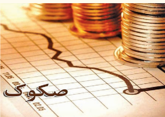
نخستین اوراق صکوک صندوق نوآوری و شکوفایی با هدف کمک به رشد تولید محصول یک دانش بنیان با ضمانت صندوق با موفقیت در بازار بورس عرضه