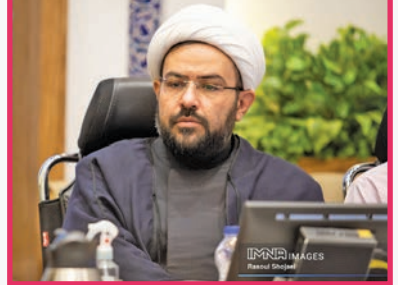
رئیس کمیسیون فرهنگی، اجتماعی و ورزشی شورای شهر: