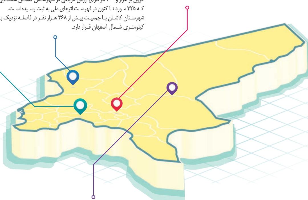
امام جمعه شهرستان جرقویه:

سختگوی اورژانس و فوریت‌های پزشکی اصفهان یادآور شد: ۱۷ مرد ۲۰ تا ۵۰ ساله در این حادثه مصدوم شدند که ۹ نفر به بیمارستان اشرفی خمینی شهر و هفت نفر به بیمارستان ۹ دی منظره منتقل شدند.