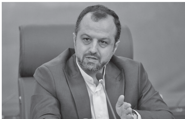
Iran's oil sector has witnessed a two-fold increase in its annual economic growth in autumn 2023, the country's Finance and Economic Affairs