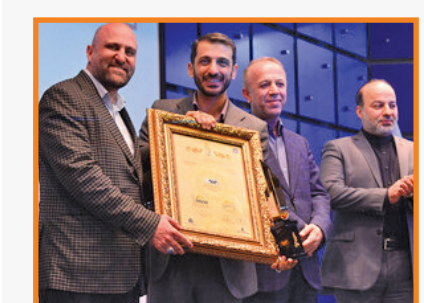
با کسب بالاترین امتیاز در طول ادوار گذشته؛