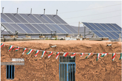
همزمان با دهه فجر، ۱۶۶۰ نیروگاه خورشیدی ۵ کیلوواتی برای خانواده‌های تحت پوشش نهادهای حمایتی با میزان سرمایه‌گذاری بیش از ۲۲۰ میلیارد تومان در سراسر کشور افتتاح می‌شود.

به گزارش ایرنا از وزارت نیرو، همزمان با دهه مبارک فجر، ۱۶۶۰ نیروگاه خورشیدی ۵ کیلوواتی برای خانواده‌های تحت پوشش نهادهای حمایتی با میزان سرمایه‌گذاری بیش از ۲۲۰ میلیارد تومان با همکاری ساتبا و نهادهای