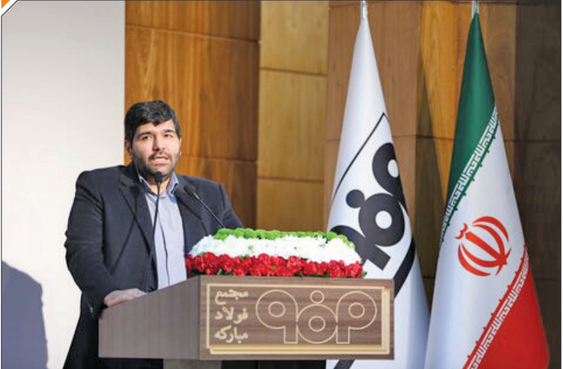
توسعه دانش کشور استفاده کنیم، قطعاً در سال‌های آتی نتیجه آن را خواهیم دید، یقیناً می‌توانیم با صنعت مأموریت خود در خدمت به جامعه را بهتر انجام دهیم.

معاون فناوری و نوآوری وزارت علوم گفت: خرسندیم از اینکه امروز فولاد مبارکه در حوزه نوآوری و فناوری سرمایه‌گذاری و پشتیبانی‌های بسیار خوبی انجام داده و الگوی بسیار مناسبی برای حل مسائل و سرمایه‌گذاری در حوزه دانش بنیان است. به گزارش ایراسین، نخستین هم‌اندیشی فناورانه دبیران اتحادیه‌ها و انجمن‌های علمی دانشجویی کشور با عنوان «روشنا» به میزبانی فولاد مبارکه و با حضور معاون فناوری و نوآوری وزارت علوم، مدیرعامل، معاونین و مدیران فولاد مبارکه روز شنبه چهاردهم بهمن‌ماه در محل برگزاری همایش‌های مرکز تحقیقات فولاد مبارکه برگزار شد.