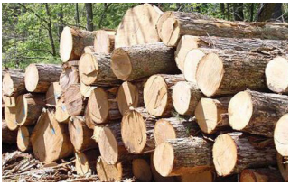
قاچاقچی چوب های بلوط در فلاورجان جریمه شد.