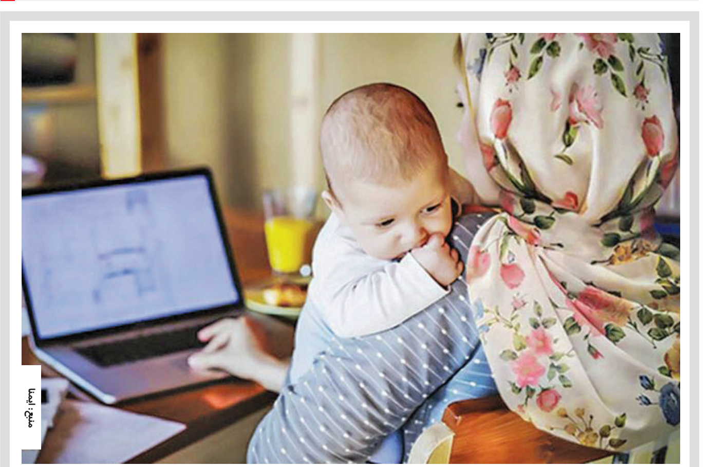
معاون رییس جمهور:

دولت به توسعه مهد کودک و تسهیل دور کاری زنان اهتمام ویژه دارد