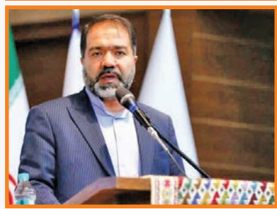
استاندار اصفهان در پیامی عنوان کرد: