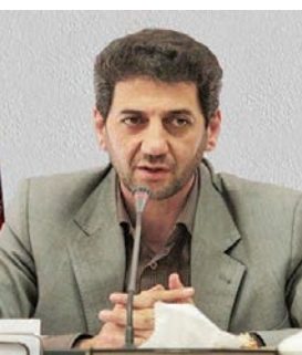
مدیرکل راه و شهرسازی استان اصفهان:

در قالب برنامه‌های عمل سالانه که به تصویب شورای راهبری هر خوشه می‌رسد، از آنها حمایت می‌کند و بخشی از هزینه‌ها را در چارچوب دستورالعمل پرداخت می‌کند. وی بیان کرد: چنین نیست که پس از اتمام برنامه سه ساله توسعه خوشه‌ها به حال خود رها شوند، بلکه این شرکت در حد بضاعت خود همواره