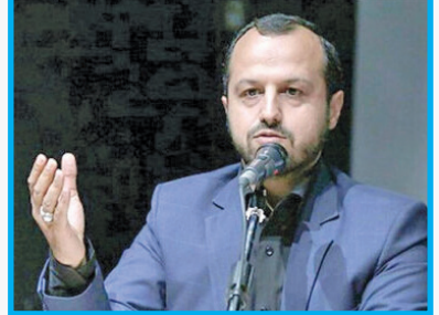
در افتتاحیه همایش اقتصاد ایران، اصلاح ساختارها و رفع ناترازی انرژی مطرح شد.