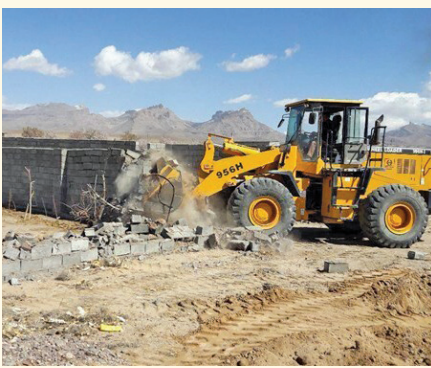
بیش از ۴ هزار و ۹۱۰ قطعه زمین کشاورزی در استان اصفهان رفع تصرف شده است.

حجت‌الاسلام‌المسلمین جعفری الگو گرفتن از اقدامات موفق سایر استان‌ها در حوزه اجرای قانون حدنگار، اجرای تمامی مصوبات شورای، سرعت در اجرای احکام، مقابله با ساخت و سازهای غیر مجاز و رفع تصرف از حریم و بستر رودخانه‌ها را از دیگر موارد مورد تأکید دستگاه قضا در استان دانست.