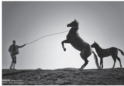
On October 18, tens of Turkmen horses will compete in a traditional beauty pageant that brings together breeders, owners, and trainers from various Iranian