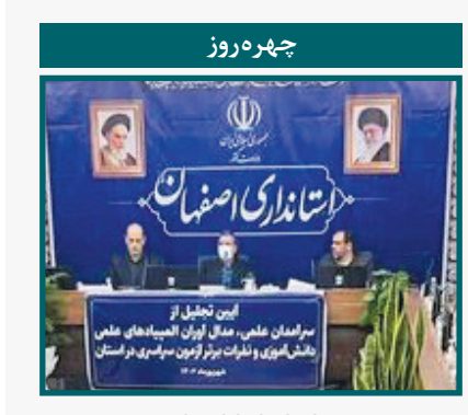
معاون استاندار اصفهان

ظهور رسانه‌های پیشرفته با بهره‌گیری از دانش نحوه تأثیرگذاری، سبب افزایش نقش رسانه در کنترل افکار عمومی شده است. امروزه رسانه‌ها نقش اجتناب ناپذیری در پیش برد برنامه‌های دولتی یا غیردولتی دارند و با ایجاد فضای رسانه‌ای برای شکل‌دهی به افکار عمومی و هدایت تصمیمات در بستر مطلوب، همواره مورد توجه دولت‌ها بوده‌اند. دولت‌ها امروزه به جای آنکه سربازان و ارتش خود را برای تسخیر کشورها و تسلط بر ملت‌ها به مرزهای دور جغرافیایی بفرستند و متحمل هزینه‌های گزاف جنگ و لشکرکشی شوند از طریق جنگ نرم و توسل به رسانه‌های دیداری و شنیداری بر مغز و قلب ملت‌های دیگر مسلط شده و ارزش‌های خود را به آنها القا می‌کنند. ایالات متحده آمریکا نیز به عنوان یک ابرقدرت توانسته است از رسانه‌های دیداری و شنیداری در راستای منافع خود بیشترین استفاده را ببرد و از طریق خیرگزارای‌ها، هالیوود، برنامه‌های ماهواره‌ای