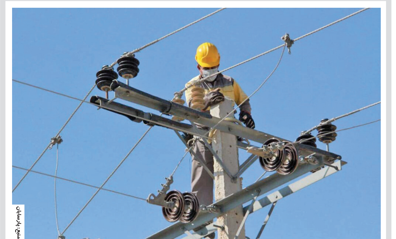
مشاور مدیرعامل شرکت توزیع برق استان اصفهان اعلام کرد: