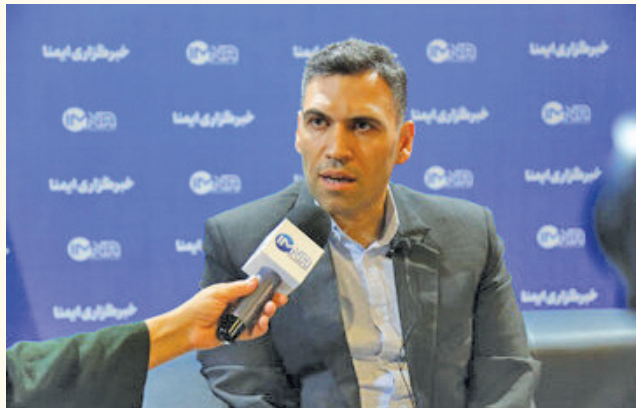
مدیر منطقه ۹ شهرداری اصفهان گفت: فناوری‌های به‌روز در این منطقه احداث به‌زودی شهرسازی روباز با امکانات و

گفت‌وگو با خبرنگار ایرنا اظهار کرد: در راستای خدمت‌رسانی شایسته و تأمین رفاه و آسایش شهروندان به‌زودی شهرسازی روباز با امکانات و فناوری‌های به‌روز در این منطقه احداث خواهد شد. وی افزود: تلاش ما بر این است تا با ایجاد فضاهای تفریحی و گردشگری، بتوانیم اوقات فراغت مناسب، سالم و نشاط‌آور را برای شهروندان در راستای نشاط اجتماعی فراهم کنیم. مدیر منطقه ۹ اصفهان تصریح کرد: در حال حاضر شهرسازی‌ها بر اساس فناوری روز، به‌صورت سرپوشیده و روباز جهت استفاده در فصول مختلف سال طراحی می‌شود.