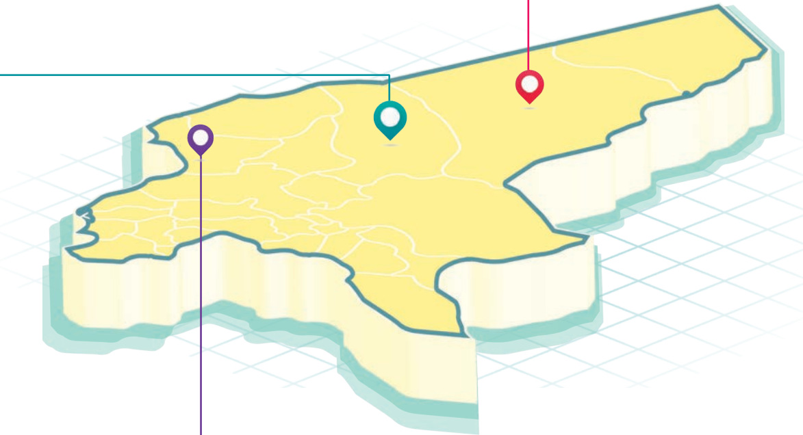
معاون گردشگری اداره میراث فرهنگی کاشان خبر داد:

وی با اشاره به اینکه دو هفته پیش آمریکا رژیم صهیونیستی در رزمایش مشترک مدعی شدند که حمله به ایران را در این رزمایش