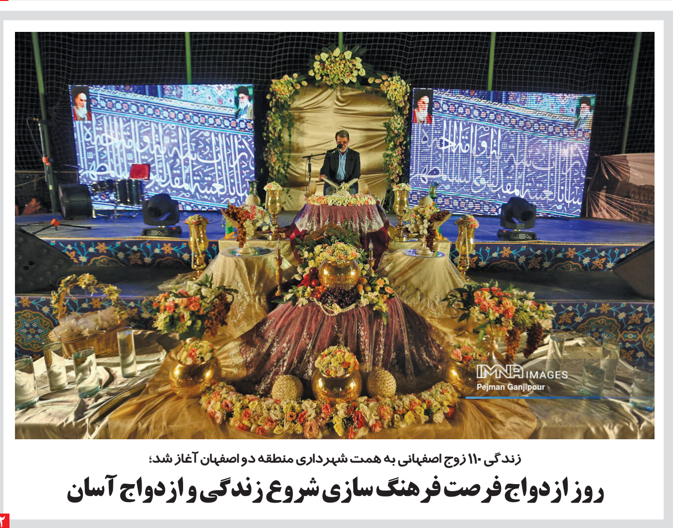
زندگی ۱۱۰ زوج اصفهانی به همت شهرداری منطقه دو اصفهان آغاز شد: روز ازدواج فرصت فرهنگ‌سازی شروع زندگی و ازدواج آسان