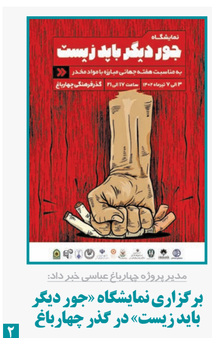
مدیر پروژه چهارباغ عباسی خبر داد: برگزاری نمایشگاه «چور دیگر باید زیست» در گذر چهارباغ