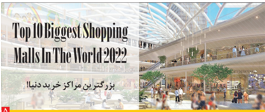
بزرگترین مراکز خرید دنیا!