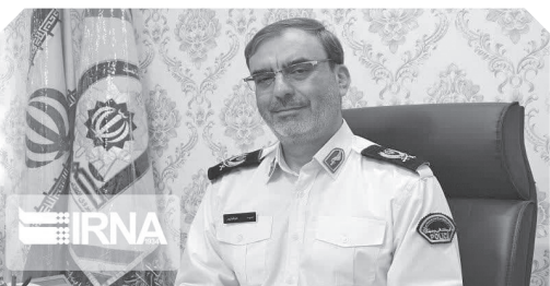
با حکم سردار احمدرضا رادان فرمانده کل انتظامی کشور،