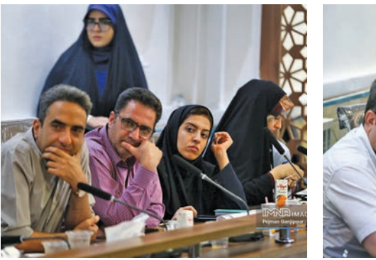
مدیرکل مدیریت بحران استانداری اصفهان عنوان کرد:

مدیر مجموعه تخت فولاد گفت: خوانش متن‌ها، عکاسی از سنگ‌قبرها، مردم‌شناسی، مختصات جغرافیایی قبور، شکل و فرم سنگ قبور و پوشش گیاهی تکایا از مواردی است که در مستندسازی اطلاعات در اولویت قرار دارد.