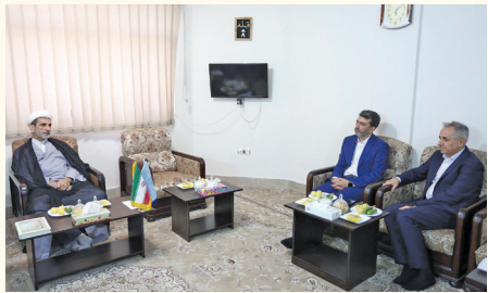
رئیس اتاق بازرگانی اصفهان به همراه نایب‌رئیس این اتاق با رئیس کل دادگستری استان دیدار و گفت‌وگو کردند. امیر کشانی رئیس پارلمان

وی افزود: شرایط اثرگذاری مثبت اتاق بازرگانی بر اقتصاد را می‌توان در سه