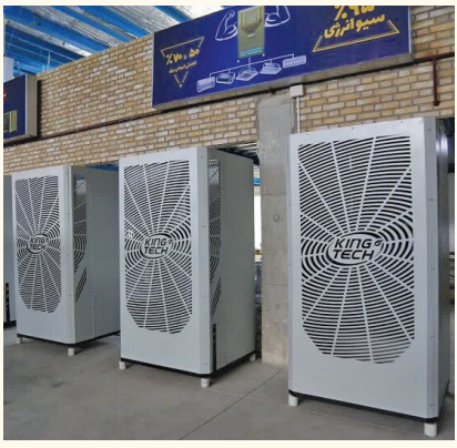
پکیج هوشمند سرمایشی و گرمایشی با قابلیت ذخیره‌سازی انرژی برای نخستین بار در کشور توسط بخش خصوصی با سرمایه‌گذاری ۱۰۰ میلیارد ریال در خراسان شمالی رونمایی شد. پکیج هوشمند سرمایشی و گرمایشی توسط بخش خصوصی وزیر نظر پارک علم و فناوری خراسان شمالی و حمایت سپاه جوادالامه (ع) راه اندازی شد و این پکیج علاوه بر مدیریت مصرف برق در پیک بار در مصرف انرژی صرفه جویی می‌کند و هزینه‌های مصرف‌کننده به صورت چشمگیری پایین خواهد آمد. این پکیج نمونه داخلی و خارجی ندارد و این طرح در سازمان ثبت اختراعات کشور ثبت شده و اقدامات لازم برای ثبت جهانی آن هم در دست اجرا است. علاوه بر استفاده سرمایشی از این سامانه می‌توان از گرمایش آن نیز بهره برد که نقش موثری در کاهش و مدیریت مصرف گاز در فصل زمستان دارد. پکیج مزبور به صورت کاملاً هوشمند عمل کرده و در اندازه‌های متفاوت برای مصارف خانگی، اداری و اماکن بزرگ قابل ساخت است که می‌تواند چندین خروجی داشته باشد و با نصب یک دستگاه همزمان نقاط مختلف از سرمایش آن استفاده کنند. فرمانده سپاه جوادالامه (ع) خراسان شمالی در آیین افتتاح این طرح بایان اینکه باید روحیه کار، تلاش و کارآفرینی مورد حمایت جدی قرار گیرد گفت: کشور به کارآفرینان و مخترعان نیازمند است و باید در این زمینه فعالیت کرد. سردار اسماعیل فرجی افزود: مهار تورم و رشد تولید نیازمند نهادینه