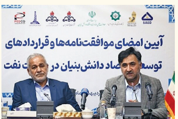
آیین امضای موافقت‌نامه‌ها و قراردادهای توسعه صادرات نفت توافق‌نامه‌های همکاری به ارزش ۵۰۰ میلیون یورو میان معاونت ریاست جمهوری با چندین شرکت نفتی بزرگ به منظور توسعه پروژه‌های دانش‌بنیان نفت و گاز به امضا رسید. آیین امضای موافقت‌نامه‌های همکاری و قراردادهای توسعه اقتصاد دانش‌بنیان در صنعت نفت با حضور معاون علمی، فناوری و اقتصاد دانش‌بنیان رئیس‌جمهوری و اقتصاد دانش‌بنیان رئیس‌جمهوری برگزار شد. روح‌الله دهقانی معاون علمی، فناوری و اقتصاد دانش‌بنیان رئیس‌جمهوری با اشاره به نقش صنعت نفت در توسعه اقتصاد دانش‌بنیان گفت: امضای این توافق‌نامه‌های همکاری، زمینه را برای ایجاد بازاری به ارزش ۵۰۰ میلیون یوروی