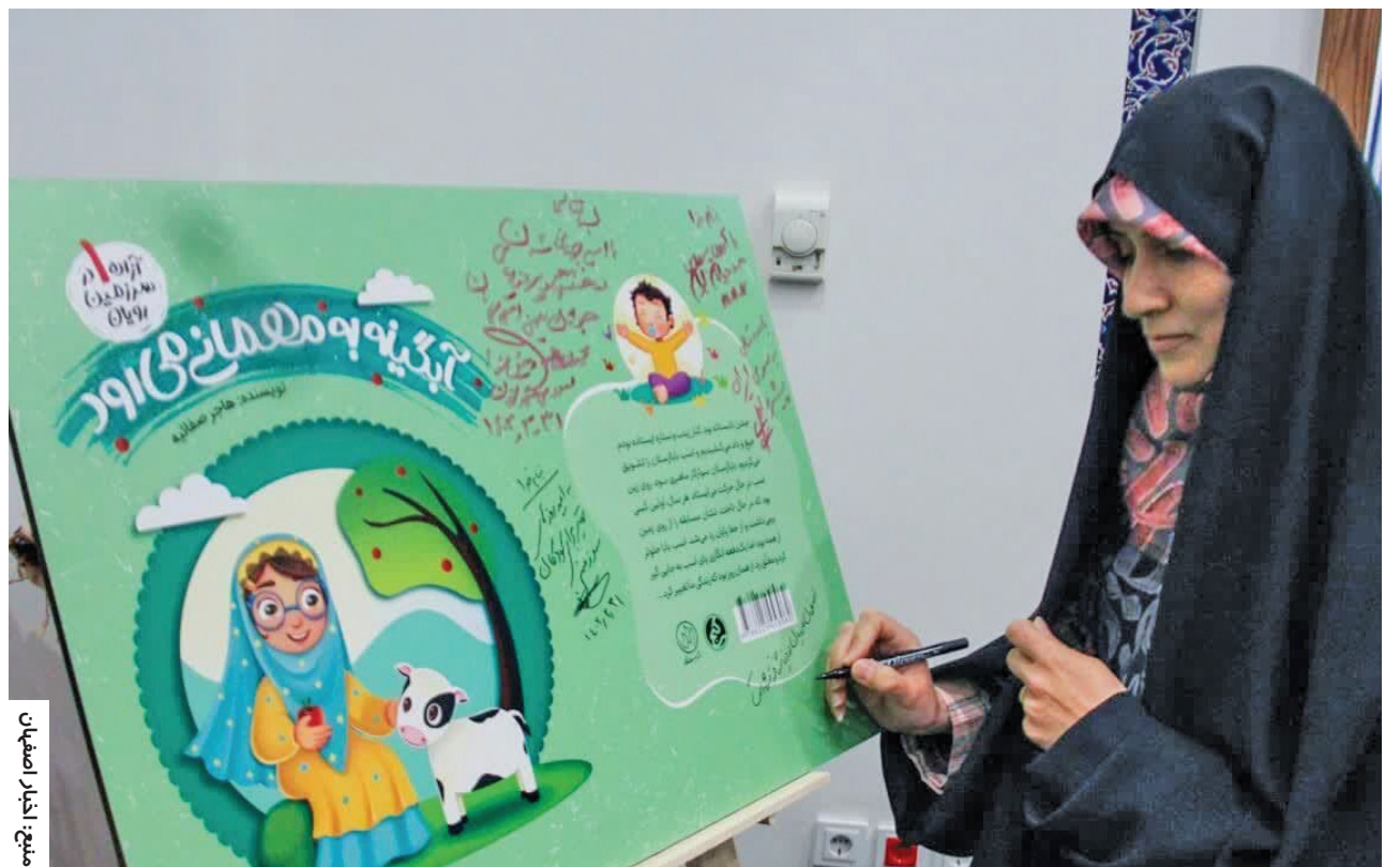
میخ: اخبار اصفهان