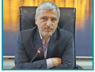
مدیر شرکت ملی پخش فرآورده‌های نفتی منطقه اصفهان در نشست خبری با اصحاب رسانه اعلام کرد: