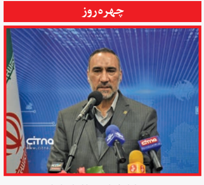
مدیرعامل شرکت مخابرات ایران در مراسم آغاز عملیات طرح

یکی از نیازهای اساسی محیط های شهری، امنیت شهری است که از ابزارهای مهم تحقق آن پیشگیری از جرم به شمار می رود؛ مدیریت شهری به عنوان دستگاه اصلی هدایت کننده توسعه شهر می تواند در پیشگیری از جرائم و افزایش امنیت نقش مؤثری داشته باشد. وظیفه تأمین امنیت برای شهروندان زمانی به خوبی انجام می شود که با اتخاذ سیاست ها و برنامه های پیشگیرانه زمینه های وقوع جرائم از میان برود. مدیریت شهری در این زمینه می تواند هم در عرصه های ساختاری، کالبدی، اجتماعی و فرهنگی مؤثر واقع شود. طراحی فضاهای شهری به گونه ای که فضاهای بی دفاع در آن کاهش یابد یا استفاده از مشارکت مردم برای تأمین امنیت محله از نمونه هایی است که می توان در این زمینه ذکر کرد. نظریه های شهرگرایی جدید و حکمرانی شهری خوب با ارائه راهبردهای مبتنی بر مشارکت و همکاری مردم در زمینه های مختلف از جمله این موارد است؛ فرایند تأمین امنیت از طریق مشارکت شهروندان از مفاهیم اصلی و بنیادی به شمار می رود. تاریخ حیات انسان، تاریخ همکاری و مشارکت است.