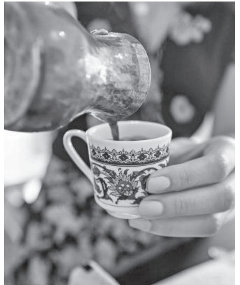
A cup of coffee would come in handy also because it might also keep you alert in case you feel sleepy after your Iftar meal.

they took in VNL 2022 as they take on the 2023 edition in June and July. Their Preliminary Phase campaign starts on June 6 and includes matches in Nagoya (Japan), Rotterdam (the Netherlands) and Anaheim (the U.S.). If they qualify for the VNL Finals, they will travel to Gdansk, Poland for the event from July 19 through 23.