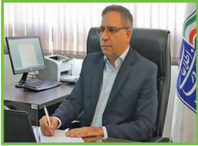
مدیر کل ارتباطات و فناوری اطلاعات اصفهان خبر داد؛