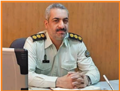
رئیس پلیس امنیت اقتصادی اصفهان: