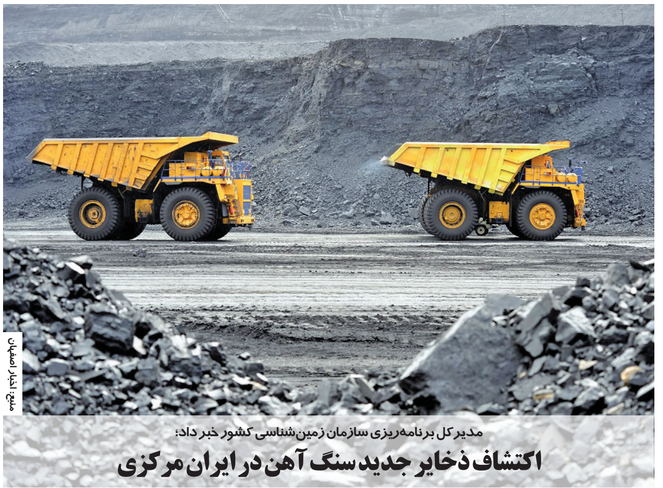
منبع: اخبار اصفهان

مدیرکل برنامه‌ریزی سازمان زمین‌شناسی کشور خبر داد: