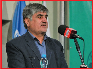
مدیرکل امور عشایر اصفهان خبر داد: