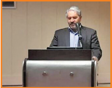
مدیرکل حفاظت محیط زیست استان اصفهان خیر داد: