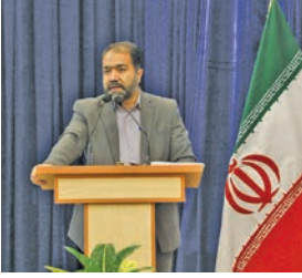
استاندار اصفهان مطرح کرد:

استاندار اصفهان گفت: حضور میدانی مدیران مرتبط برای نظارت، رصد و پیش‌بینی قیمت‌ها در بازار شب عید ضروری است. سیدرضا مرتضوی در هفتاد و هفتمین جلسه ستاد تنظیم بازار استان که با حضور مدیران کل مرتبط و به صورت ویدئو کنفرانس با حضور فرمانداران برگزار شد، بر ورود جدی مسئولان دستگاه‌های نظارتی بر کنترل و ساماندهی قیمت اقلام اساسی در بازار تأکید کرد. وی در این نشست با تأکید بر حضور میدانی مدیران و مسئولان